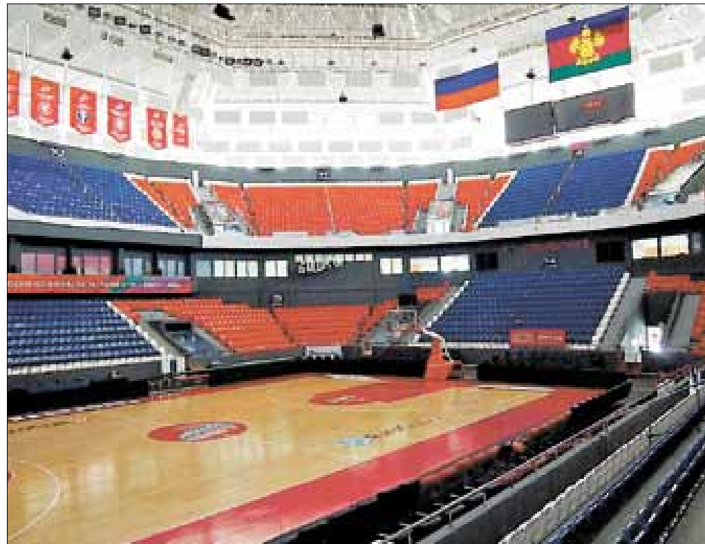
■ «Баскет-холл» сейчас является домашней ареной клуба «Локомотив-Кубань»

Внешне стадион напоминает Колизей, а про его технические характеристики и возможности можно сказать – на грани возможного. Он один из лучших в Европе. Размер игровой зоны – 105 на 68 метров. Футбольное поле построено с применением всех современных технологий: подогрев, принудительная аэра-