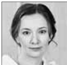
Анна КУЗНЕЦОВА Уполномоченный при президенте РФ по правам ребенка поддержала новое постановление правительства РФ по материнскому капиталу