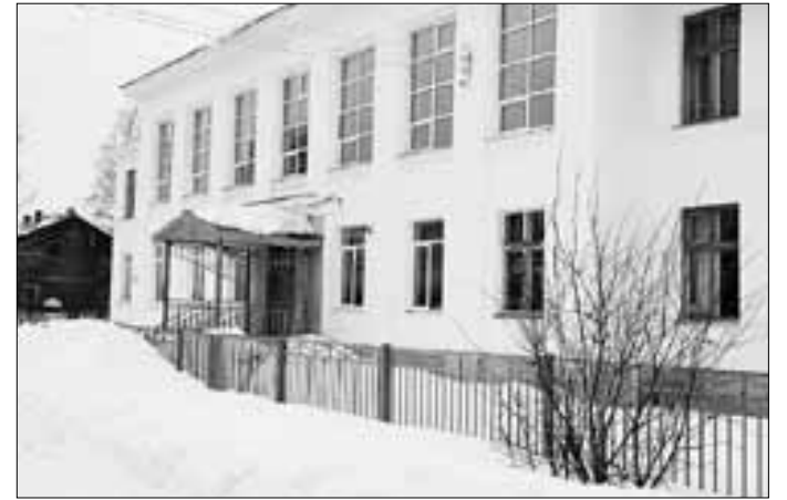
■ Школе № 60 необходим ремонт