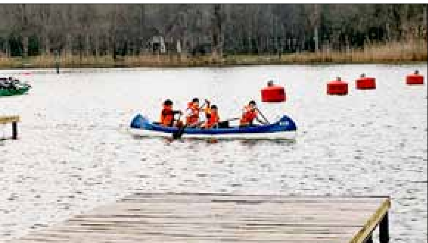
■ Тренируется на озере Старая Кубань