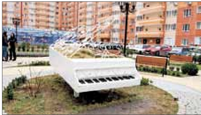
■ Такие дворы появляются благодаря социально ориентированному подходу застройщиков к своей работе