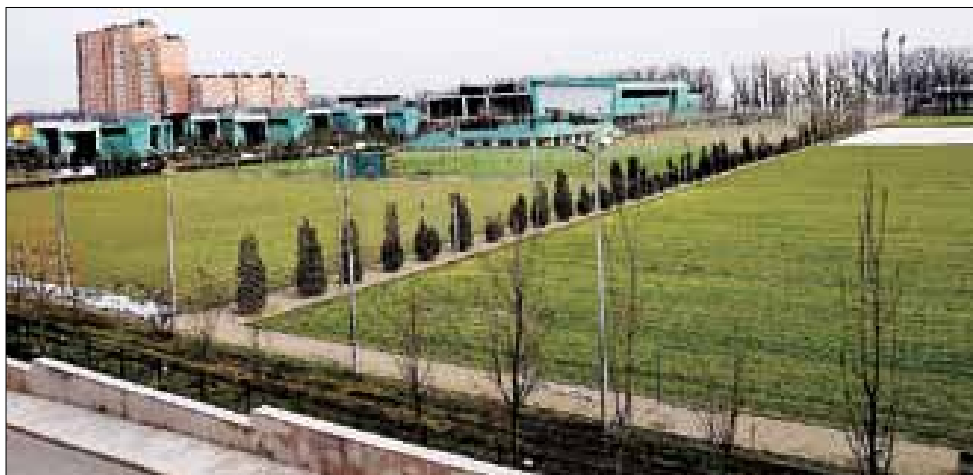
■ Здесь растут будущих звезд российского футбола