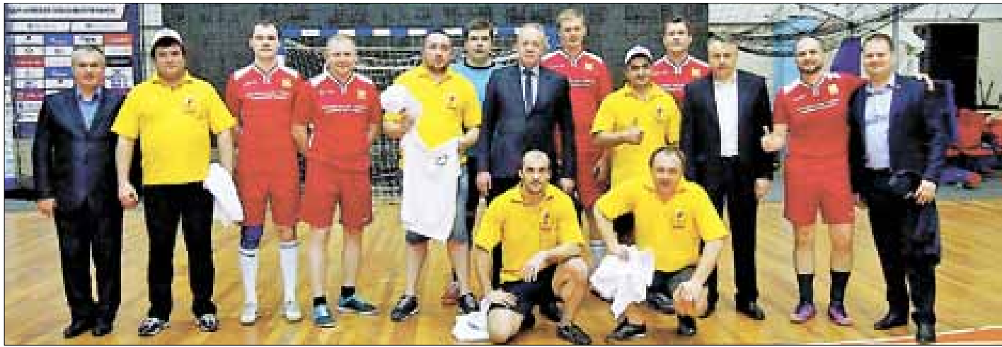
■ Архангелогородцы и краснодарцы провели товарищеский футбольный матч