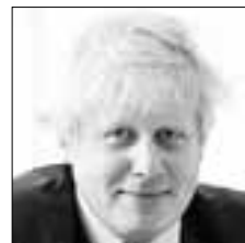
Борис ДЖОНСОН Глава МИД Великобритании накануне визита в Москву рассказал журналистам о нежелательности новой «холодной войны»

«Как многодетная мама, полностью поддерживаю эту новацию. Сокращение срока перечисления средств материнского капитала, а также определение алгоритма направления их на улучшение жилищных условий в соответствии с действующим законодательством позволит существенным образом оказать поддержку прежде всего многодетным семьям»