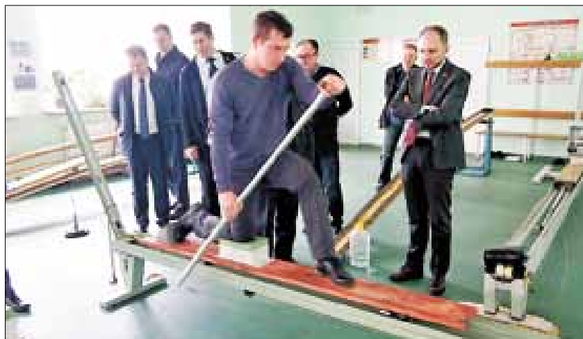
■ Демонстрация работы гребного тренажера