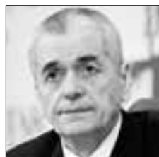
Геннадий ОНИЩЕНКО Депутат Госдумы в интервью РИА Новости назвал вейпы угрозой национальной безопасности России