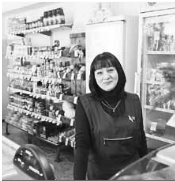
■ «Соседом» продовольственного отдела станет аптека