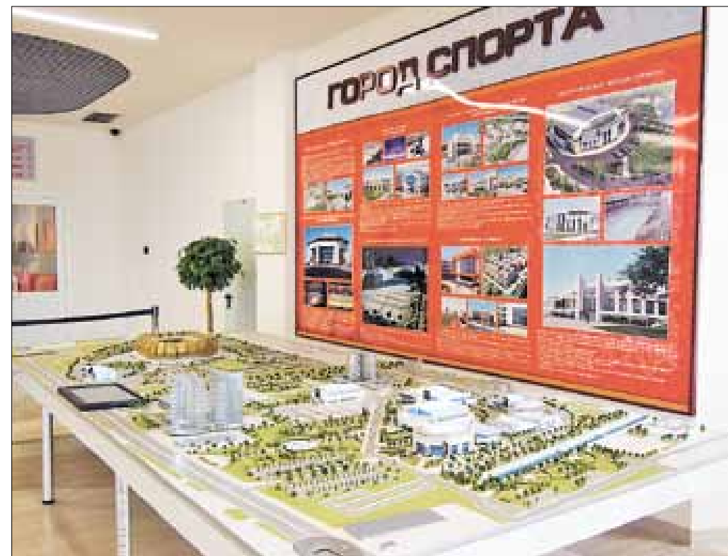
■ Многофункциональный комплекс «Город спорта» не имеет аналогов в России