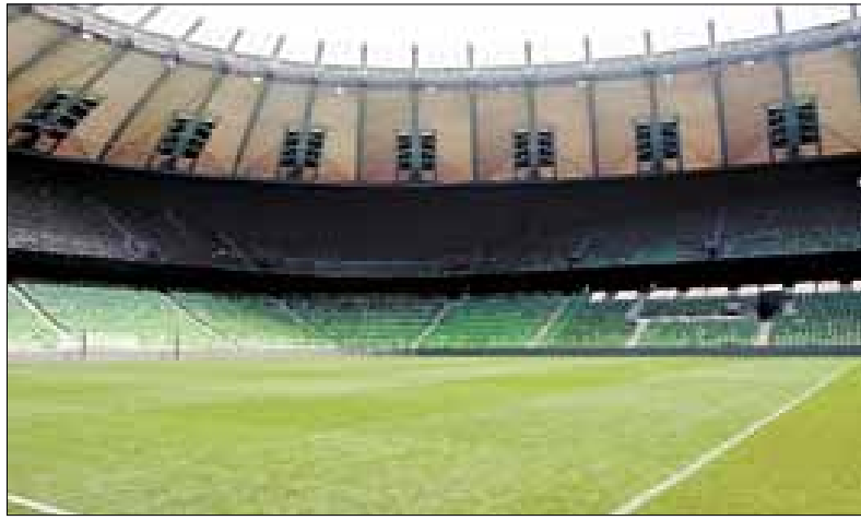
■ Суперсовременный стадион футбольного клуба «Краснодар» был построен благодаря частным инвестициям