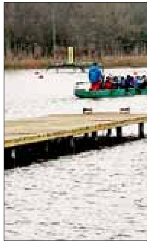
■ Водно-гребная база рас