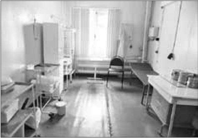
■ Эксплуатировать здание старого ФАПа уже небезопасно